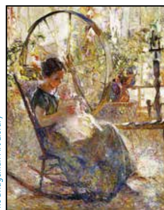
The Bridgeman Art Library

Crédit photo : Mother and Child de John E. Costigan.