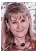
M. SCHEFFLER* propos recueillis par E. PAGANELLI**

Quelles mesures pour relever les nouveaux enjeux sanitaires et redonner confiance aux praticiens et aux patients ?