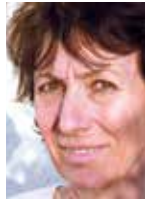
P. SAINT-MARTIN* propos recueillis par E. PAGANELLI**

E. P : On sait que les femmes qui subissent des violences intrafamiliales passent le plus souvent sous silence les faits dont elles sont victimes. Quels sont vos conseils pour repérer ces violences lors de la consultation gynécologique ?